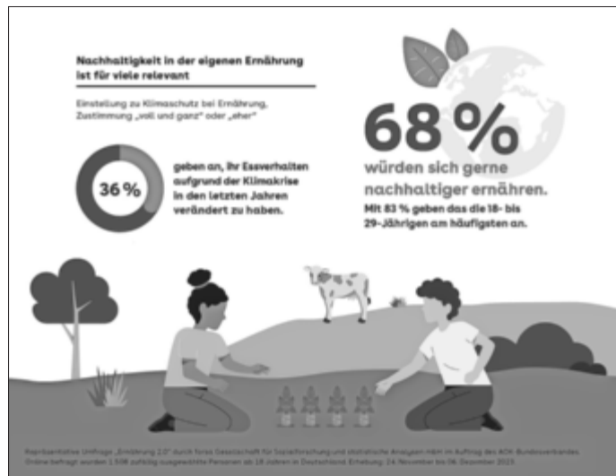
Mehr als zwei Drittel der von der AOK Befragten würden sich gerne nachhaltiger ernähren.