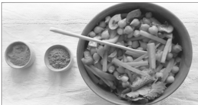
Hülsenfrüchte sind ebenso klimafreundliche wie gesunde Eiweißlieferanten und lassen sich vielseitig in der Küche verwenden.

Internet-Tipp: Unter https://www.aok.de/pk/thema/klimafreundliche-ernaehrung/ sind zahlreiche Informationen zu nachhaltiger Ernährung und weitere Rezeptideen zu finden.